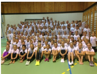
Deltakere på leiren i 2016!

Leiren er for jenter og gutter mellom 9 og 16 år som er medlem i en turnforening. Vi stiller med kvalifiserte trenere og godt utstyr.